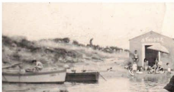
Sci Club SaintTropez nel 1960