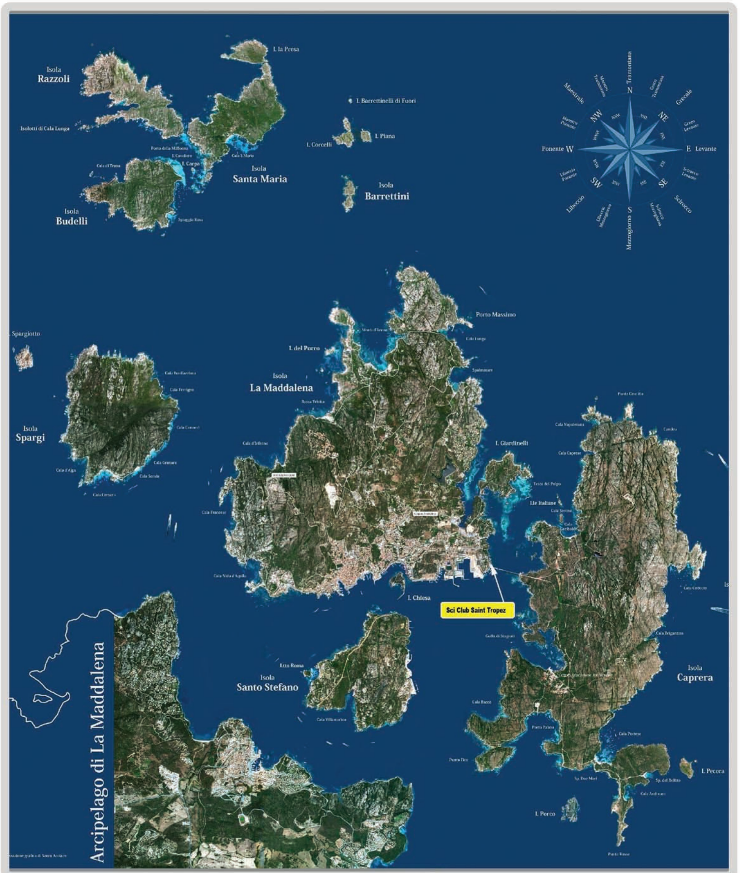
Elaborazione grafica: Santo Acciario