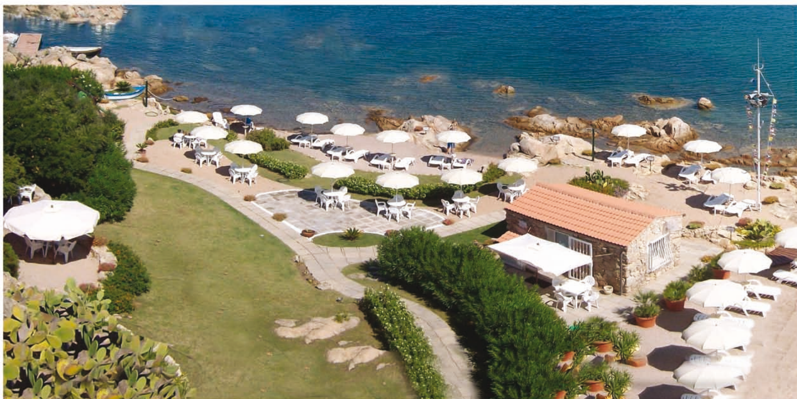
Panoramica Centro Nautico

Area giochi a mare con tappeti elastici, scivoli e prendisole