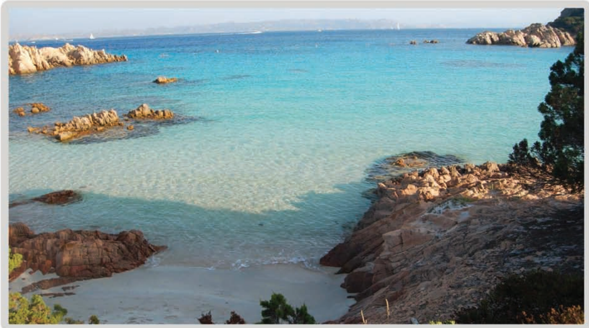
Scorcio trasparenze ( isola di Budelli - Arcipelago di La Maddalena)