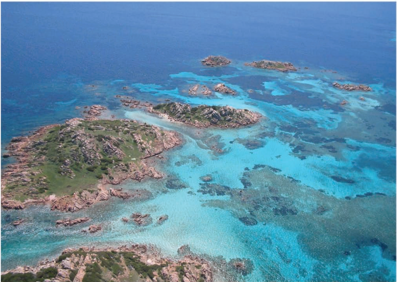
Veduta aerea Isole Arcipelago di La Maddalena

Spargi, Spargiotto, Razzoli, Santa Maria, Budelli, Caprera, Santo Stefano, Barrettini, Monaci, Bisce., Soffi, Camere, Mortori, Nibani, contornano a corona l'isola Madre di La Maddalena, dove la flotta e gli equipaggi delle marine militari e mercantili, sia italiane che straniere, hanno in passato trovato conforto e riparo e dove persino l'Ammiraglio Nelson ha sostato a lungo (tra le famose battaglie navali di Abukir e Trafalgar), considerando questi approdi come i migliori in assoluto nel Mediterraneo.