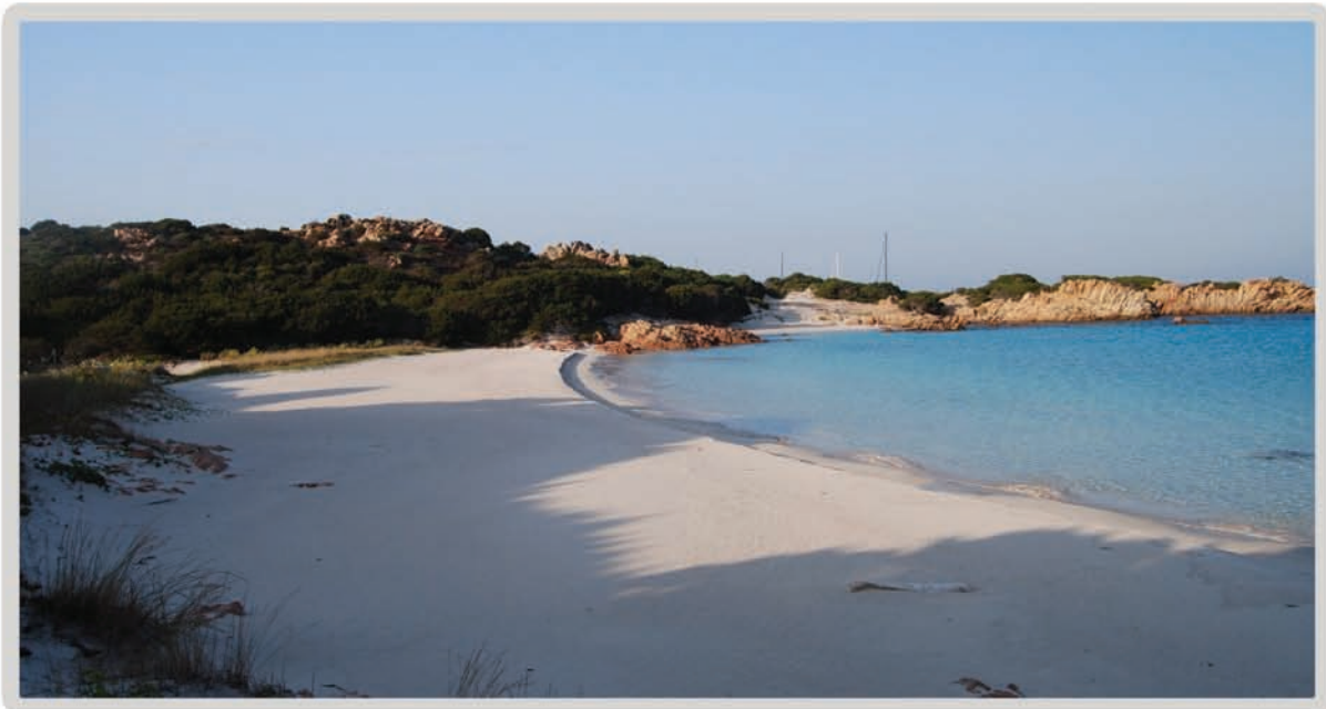
Veduta Spiaggia Rosa ( Isola di Budelli - Arcipelago di La Maddalena)